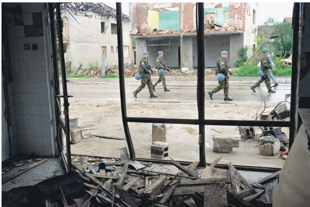
FN-soldater på patrulje i Bosnien i 1994, hvor borgerkrigen havde raset i to år.