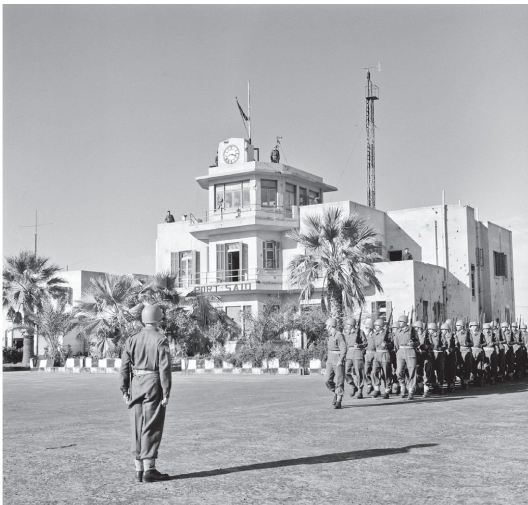
Danske FN-soldater i UNEF marcherer 21. december 1956 ind i lufthavnen i Port Said i Ægypten. Her fik de overdraget ansvaret for området fra britiske flyversoldater.

Fra slutningen af 1940'erne kom konflikten mellem de to supermagter Sovjetunionen og USA til at dominere verdenspolitikken – det som man også kalder den kolde krig. Begge lande sad i FN's Sikkerhedsråd, og de var meget uenige om, hvordan verdenssamfundet skulle gribe ind i krige og konflikter. Det betød, at de ofte nedlagde veto mod hinandens forslag i FN's Sikkerhedsråd, og derfor var der ikke mange FN-missioner under den kolde krig. Koreakrigen var dog en undtagelse. I 1950 boykottede Sovjetunionen FN's Sikkerhedsråd, hvilket betød, at landet ikke kunne nedlægge veto mod FN-missionen i Korea, som derfor blev oprettet, selv om Sovjetunionen var imod FN's indgriben i konflikten. Ellers var det generelle billede under den kolde krig, at det kun var, når hverken USA's eller Sovjetunionens interesser var truet, at Sikkerhedsrådet kunne træffe beslutninger. Den danske regering frygtede, at Sovjetunionen ville forsøge at gøre Danmark til et kommunistisk land, og Danmark kom i 1949 ind i forsvarsalliancen NATO, der bestod af USA, Canada og en række europæiske lande. Samtidig var Danmark stadig en ivrig tilhænger af FN's fredsbevarende arbejde.