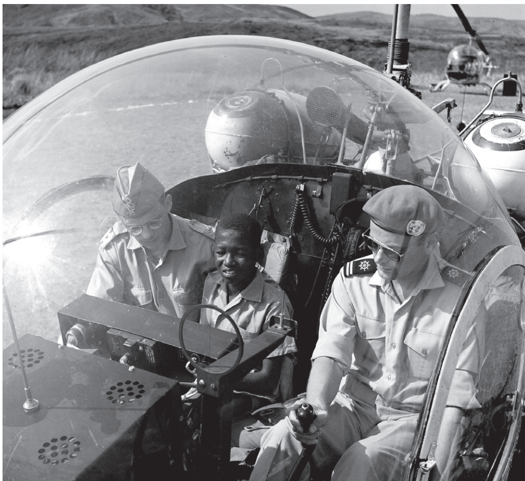
En dansk helikopterbesætning flyver i oktober 1960 en syg dreng fra en nærliggende landsby til Matadi hospitalet i Congo.

Før Anden Verdenskrig havde mange af de europæiske lande kolonier i Asien og Afrika. I 1950'erne og 60'erne blev de fleste af kolonierne omdannet til selvstændige stater. Det gav ofte anledning til borgerkrige, hvor befolkningsgrupper eller politiske partier med våbenmagt forsøgte at få magten i de nye lande. Det gigantiske afrikanske land Congo fik en meget tumultagtig begyndelse som selvstændig nation. Området, der var på størrelse med Grønland, havde været en belgisk koloni. Belgierne havde ikke sørget for at uddanne landets indbyggere særligt meget, så da de i 1960 med kort varsel overlod Den Demokratiske Republik Congo til lokalbefolkningen, manglede congoleserne forudsætningerne for at styre et land. Resultatet var kaos. Den nyoprettede congolesiske hær gik til angreb på de belgiere, som var tilbage i landet. Belgien sendte faldskærmstropper ind for at beskytte sine landsmænd. En af landets største og rigeste provinser - Katanga - erklærede, at den havde løsrevet sig fra Congo, og nu var en selvstændig nation. Den tidligere belgiske koloni Congo var ved at gå i opløsning. FN's generalsekretær - svenskeren Dag Hammarskjöld - bad landene i FN's Sikkerhedsråd om et mandat til, at FN kunne hjælpe Congo med at få genoprettet ro og orden og støtte landet med at opbygge statslige institutioner. 14. juli 1960 oprettede FN's Sikkerhedsråd FN-missionen - Organisation des Nations Unies à Congo (ONUC) - der skulle yde teknisk assistance til den meget