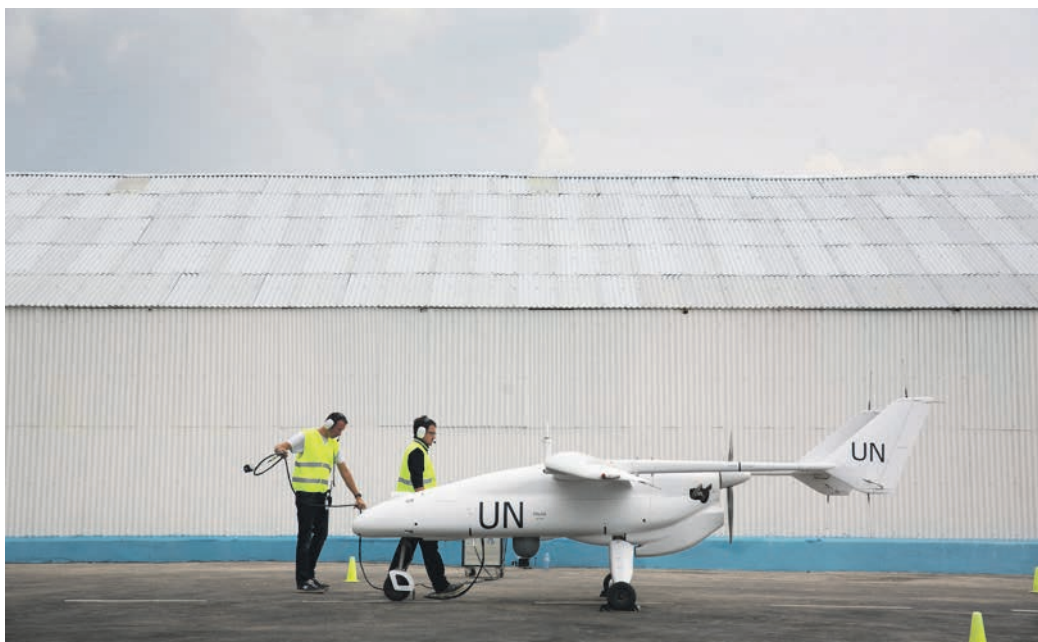
FN's overvågningsdrone i Goma i Den Demokratiske Republik Congo, hvor FN-missionen Monusco skal bruge den til at få et bedre indblik i situationen i landet. Det er første gang FN anvender ubevæbnede overvågningsdroner og det viser verdensorganisationens større vilje til at indsamle efterretninger på deres fredsbevarende operationer.

Brahimirapporten gik også i rette med Sikkerhedsrådets arbejde og kritiserede Rådets medlemmer for at formulere uklare mandater. Ifølge Brahimirapporten burde medlemmerne i højere grad sørge for, at missionerne opererer under klare mandater, der er troværdige samt opnåelige. Tidligere gik mange mandater ud på, at FN-missionerne skulle opnå fred og stabilitet. Det er dog svært at måle, hvornår der er tilstrækkelig fred og stabilitet i et område og dermed, hvornår FN har løst sin opgave. I dag er der en tendens til, at Sikkerhedsrådet skriver for mange elementer ind i mandaterne, så FN-missionerne skal tage sig af alt fra fremme af menneskerettigheder til beskyttelse af kvinder og børn. Det er formål, der kan være svære at opfylde i praksis for FN-soldaterne ude i felten. FN blev i 1990'erne også kritiseret for at lægge for store restriktioner på soldaternes anvendelse af magt. På Balkan viste den nordiske bataljon i Tuzla, at en resolut optræden af de danske kampvogne gjorde det lettere for FN-styrken at tvinge sin vilje igennem overfor krigens parter. I dag er FN mere fleksibel i forhold til at gøre brug af magtanvendelse, hvis volden i et land eskaleres. For eksempel har FN i Congo oprettet en interventionsbrigade på 3500 mand, som kan gribe ind, hvis krigshandlinger blusser op og truer civilbefolkningen.