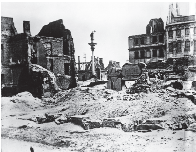
Det sønderbombede Warszawa september 1939. Polen var det første land, som blev udsat for Anden Verdenskrigs ødelæggelser.

Det blev i 1945 til de Forenede Nationer i daglig tale FN. Faktisk eksisterede der allerede en international organisation nemlig Folkeforbundet, der var blevet grundlagt efter Første Verdenskrig 1914-18, men dens virke havde været en fiasko blandt andet, fordi USA ikke var medlem. For at sikre sig at FN ikke led samme skæbne som Folkeforbundet, fik verdens fem stormagter USA, Sovjetunionen, Storbritannien, Kina og Frankrig en særlig rolle i organisationen. De fik permanent sæde i organisationens Sikkerhedsråd, der tager stilling til konflikter i verden. Desuden kan de fem permanente medlemmer nedlægge veto mod beslutninger i Sikkerhedsrådet.