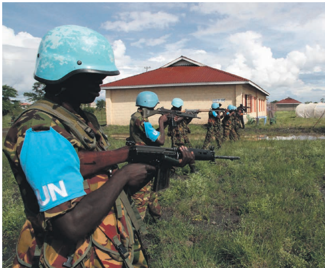
Kenyanske soldater fra East Africa Stanby Forces træner fredsbevarende opgaver. Danmark støtter sammen med de andre nordiske lande opbygningen af en østafrikansk udrykningsstyrke, som i fremtiden skal kunne gribe ind over for voldsomme begivenheder i regionen.

I 2005 fik SHIRBRIG en ny opgave. Styrken skulle medvirke til at sikre en fredsaftale mellem den sudanesiske regering og oprørsstyrker i den sydlige del af landet. Landene i SHIRBRIG havde dog kun ganske få soldater til rådighed til en ny FN-mission, så de fleste soldater måtte FN hente uden for SHIRBRIG-landene. Danmark stillede med omkring 45 soldater til FN-missionen i Sudan, der hovedsageligt arbejdede i hovedkvarteret i Khartoum, mens en mindre gruppe var placeret i Juba i den sydlige del af landet. UNMIS afsluttede sin opgave, da Sydsudan blev selvstændigt i 2011. Ud over de to store opgaver i Eritrea og Sudan havde SHIRBRIG's planelement endnu fire mindre udsendelser, hvor de støttede FN og organisationen af vestafrikanske lande (ECOWAS) med planlægningsopgaver og nye missioner.