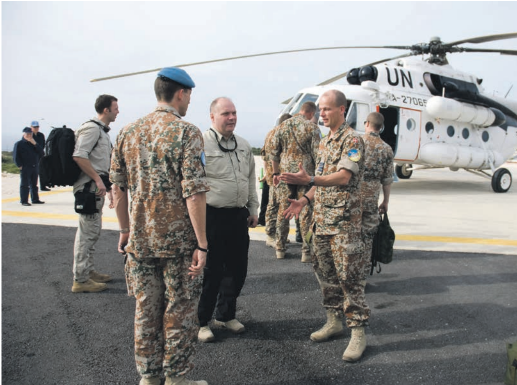
Tidligere forsvarsminister Søren Gade besøger FN-missionen UNIFIL i Libanon i februar 2010. Det er Danmarks regering, som, hvis der er flertal for det i Folketinget, beslutter om Danmark vil udsende soldater til en FN-mission.