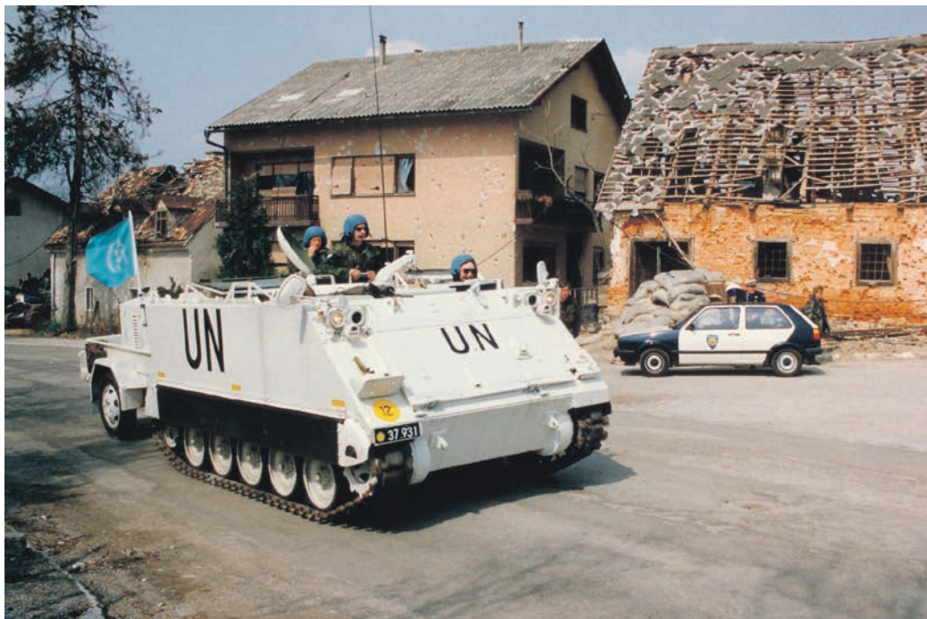
Danske FN-soldater fra UNPROFOR i en pansret mandskabsvogn kører ind i den ødelagte by Karlovac i Kroatien.

Omkring 1990 opstod et helt nyt verdensbillede. Sovjetunionen gik i opløsning, og USA stod tilbage som verdens eneste supermagt. De kommunistiske regimer i Østeuropa faldt som dominobrikker. En myriade af nye stater opstod i Østeuropa og i det tidligere Sovjetunionen. I Danmark åndede politikerne lettet op. Der var ikke længere en trussel