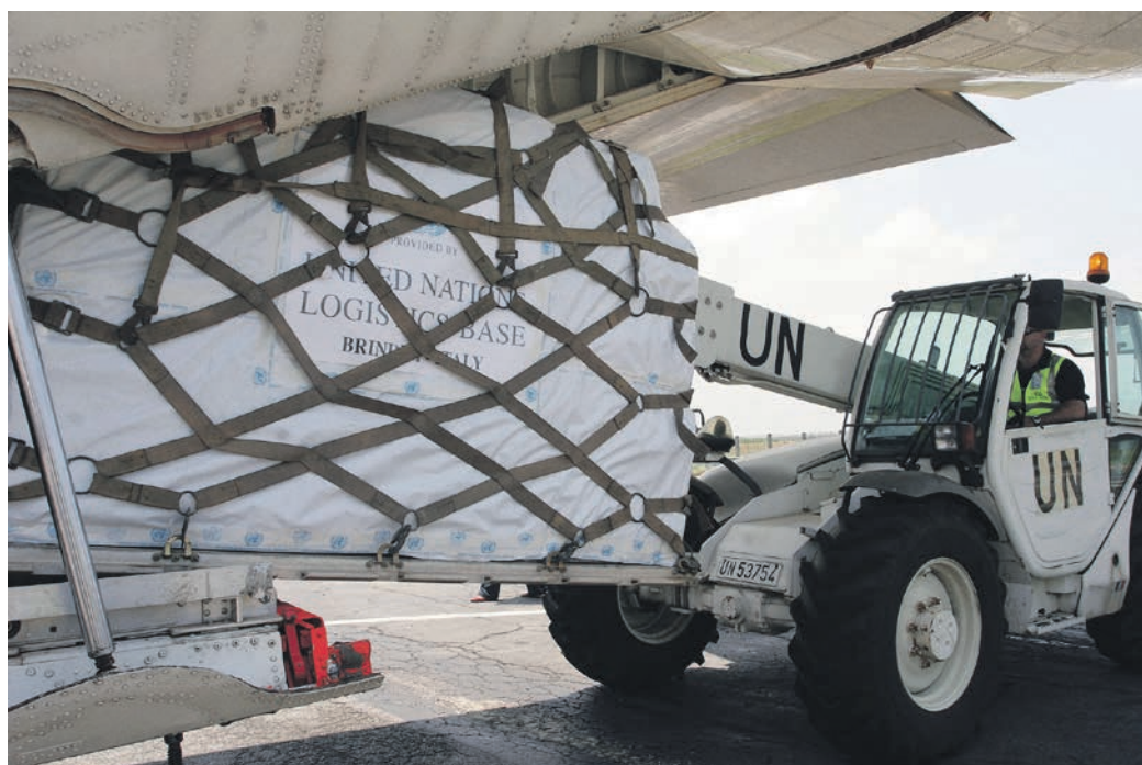
Forsyninger til FN-missionen i Elfenbenskysten ankommer fra den logistiske base i Brindisi.

Et af resultaterne af Brahimirapporten var indførelsen af "fact finding". Hvis FN på forhånd havde været bedre kendt med forholdene i Somalia, på Balkan og i Rwanda, kunne nogle af problemerne være undgået. Derfor sender FN nu altid et hold civile og militære eksperter til et konfliktområde, inden de opretter en mission, så organisationen har fri-ske informationer fra et potentielt missionsområde, før den fredsbevarende indsats går i gang. Brahimirapporten gjorde også op med FN's manglende brug af efterretninger. Det var tidligere et fyord i FN, men i dag vil FN bruge kommercielle droner til at overvåge situationen i det enorme afrikanske land Congo, hvor FN opererer. Også i den nyeste FN-mission – MINUSMA – i Mali vil FN afsætte flere soldater til at indhente efterretninger.