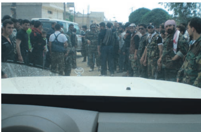
Til højre soldater fra den frie syriske hær. For at FN-observatørerne kunne bevæge sig sikkert rundt, gjaldt det om at have gode kontakter på begge sider af konflikten.

Ved midnat 6. juni rapporterede CNN, at der havde fundet en massakre sted i byen Al Qubain. Næste dag fik Peter Dahl ordre fra UNSMIS' norske chef om at organisere en undersøgelse af påstandene. Al Qubain lå i et oprørskontrolleret område, hvor FN-observatørerne ingen kontakter havde på forhånd. Erfaringerne fra krigen havde vist observatørerne, at der let kunne opstå en kaotisk situation, når de besøgte en traumatiseret landsby. Alle ville på en gang fortælle om det frygtelige, der var sket. Og glæde over at se FN kunne hurtigt vende sig til vrede over FN's afmagt.