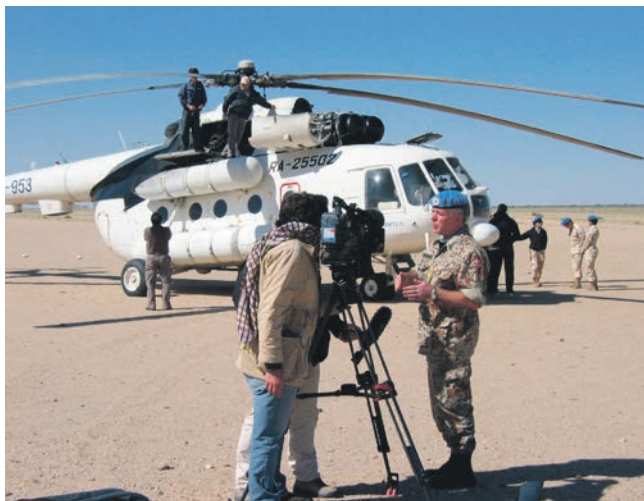
Mens våbnene tiede, førte parterne i striden om Vestsahara krig via medierne. Det gjaldt derfor om at være meget påpasselig, når Kurt Mosgaard skulle udtale sig, så det ikke kunne opfattes, som om han havde mere sympati for den ene side end den anden.

Hertil kommer, at FN er den mest veludviklede organisation til at varetage en civil genopbygning efter en krig, det vil sige opbygningen af statslige og kommunale strukturer, koordination af udviklingshjælp inklusiv skoleuddannelse med videre. Kurt Mosgaard