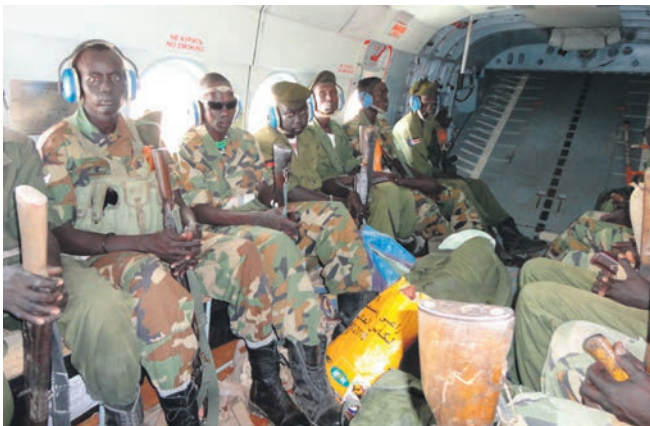
Soldater fra Sydsudans hær - SPLA - på vej til delstaten Jonglei for at stoppe stammekrige.

ner. Derfor skulle Jacob Palmer Bjerborg og de andre forbindelsesofficerer fungere som militærrådgivere, der skulle støtte og rådgive SPLA.