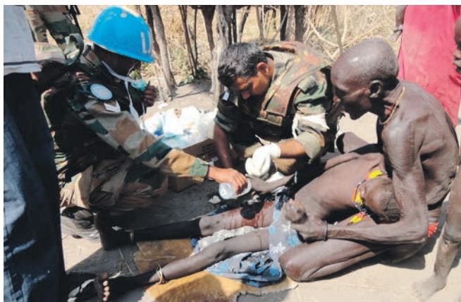
Indiske soldater behandler ung pige, der er blevet såret under stammeopgør i bushen.

Hen over julen 2011 var Jacob Palmer Bjerborg i sin uformelle rolle som observatør førstehåndsvidne til en voldsom væbnet konflikt mellem flere stammer i Sydsudan. Gennem samtaler med lokale ledere, repræsentanter fra internationale organisationer og officerer fra SPLA kunne FN-observatørerne følge med i og rapportere om, hvordan konflikten mellem stammerne blev trappet op. Og via patruljer først og fremmest med helikopter