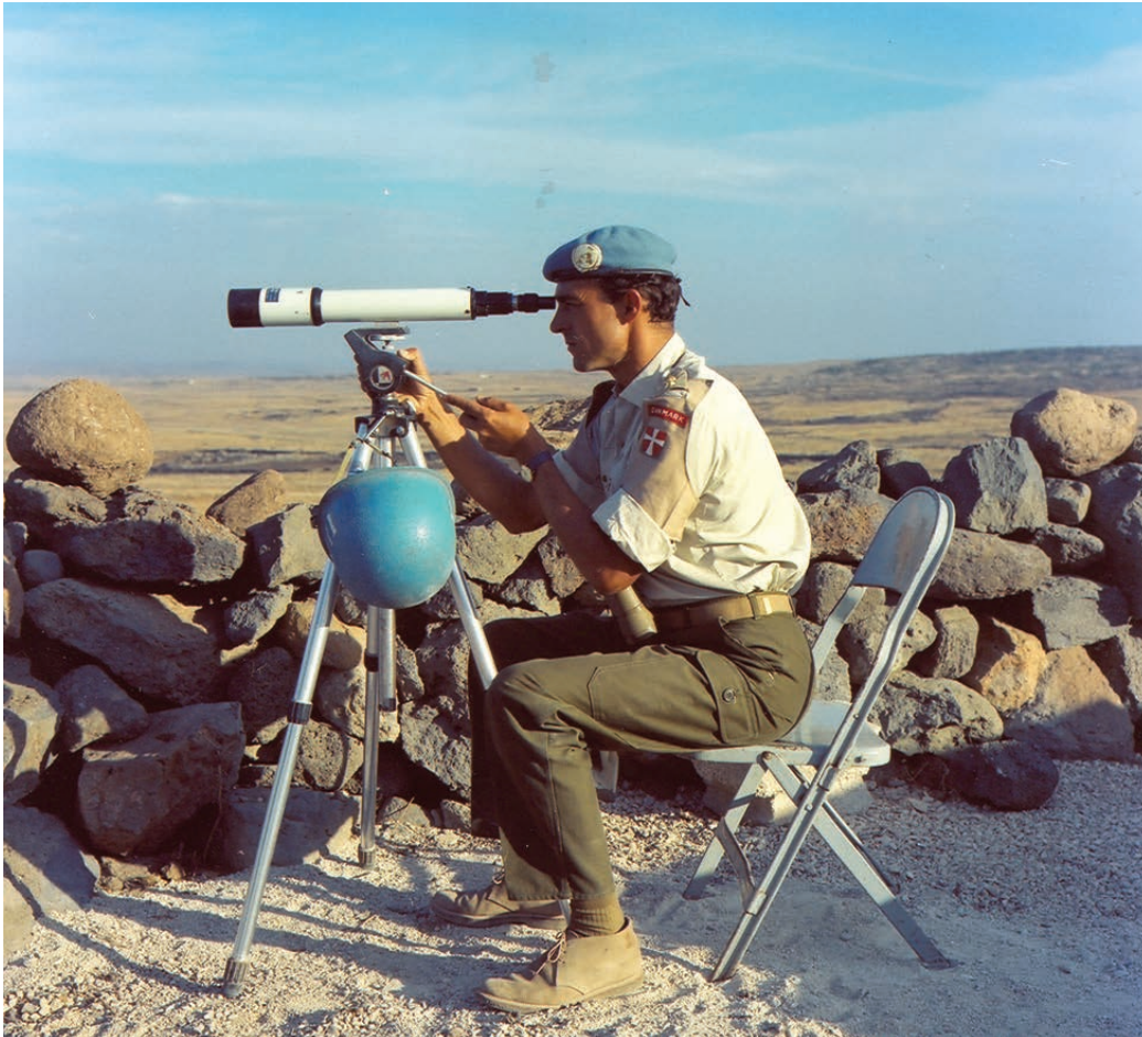
Dansk FN-observatør i ingenmandsland mellem Israel og Syrien i 1966.

Desuden var deres opgave at sende rapporter til FN-hovedkvarteret i New York. Observatørerne var afsted i mindst et år, og de kunne tage deres familie med på missionen. Familierne skulle indkvarteres privat. Det var vigtigt, at FN-observatørerne var strengt neutrale og ikke tog parti for eksempelvis enten inderne eller pakistanerne. Danske officerer viste sig at være gode til denne opgave.