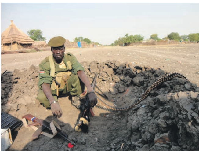
SPLA-soldat i skyttehul forud for stammeangreb.

Jacobs tid i Afghanistan og hans missionserfaringer i det hele taget betød også, at han – modsat mange andre forbindelsesofficerer – ikke havde noget problem med at leve under de meget primitive forhold i felten eller var bange for at tage med ud, når soldaterne fra SPLA var indsat i skarpe operationer. Derfor kunne han være til stede og levere observationer på en måde, som FN ikke var vant til.