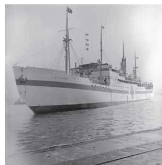
Det danske hospitalsskib Jutlandia ankommer til Pusan i Sydkorea 1. marts 1951.

I 1950 kom Danmarks velvilje over for FN på en alvorlig prøve. Denne gang bad FN om soldater til en regulær krig. Med USA i spidsen havde FN's Sikkerhedsråd besluttet at støtte Sydkorea militært, efter at landet var blevet invaderet af det kommunistiske Nordkorea. Den danske regering var betænkelig ved at skulle sende soldater til Sydkorea. Det danske forsvar var slet ikke klar til krig, og desuden var danske politikere bange for, at det ville provokere Sovjetunionen, hvis danske soldater drog i krig i Korea. Sovjetunionen var efter Anden Verdenskrig den stærkeste militærmagt i Europa og havde medvirket til, at mange østeuropæiske lande var blevet til kommunistiske diktaturstater.