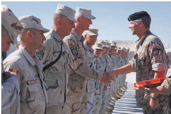
Bosniske soldater får overrakt en medalje for veludført tjeneste i Helmandprovinsen af chefen for det danske ISAF hold 14, oberst Kresten Hedegård.

Det bosniske bidrag til operationerne i Afghanistan viser, at fredsbevarende arbejde kan betale sig, selv om det ind imellem virker håbløst. Bosnien er gået fra at være et land, der krævede en massiv international indsats for at forhindre en humanitær katastrofe, til at blive en nation, som hjælper andre lande med at komme på fode.