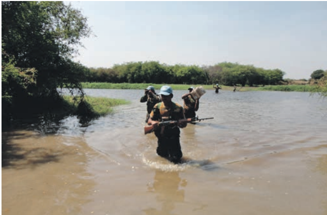
Indiske soldater passerer flod under patrulje i bushen i Jonglei delstaten.

- Afmagt. Det er noget af det, der er sværest ved at arbejde for FN. Det er en af de stærkeste følelser, man skal kunne håndtere som soldat. Afmagten rammer, når man føler, man ved, hvad der kræves, og man står i situationen og oplever, at verdenssamfundet tilsyneladende ikke vil gøre det, der er nødvendigt. Og det ender med, at kvinder og børn bliver slået ihjel, og man så bliver sendt ud for at dokumentere det bagefter. Man bliver ansigtet på FN's manglende vilje til at gøre noget ved det. Jeg har haft nogle alvorlige oplevelser, som jeg bagefter også har grædt over, og jeg har tænkt, om det er spøgelse, der skal forfølge mig resten af livet. Men jeg tænker også, at nogen skal gøre det, og så er det bedre, at det er mig, fordi jeg har troen på, at jeg har robustheden til at håndtere det følelsesmæssige pres.