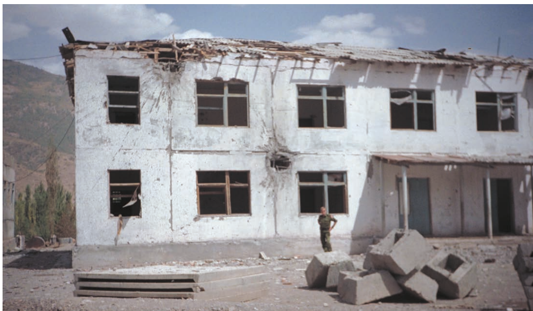
Krigshærgen bygning i det centralasiatiske land Tadsjikistan. I forgrunden står en dansk FN-observatør.

Derfor fik mange missioner for få og dårligt udrustede soldater. Parterne i de mange konflikter var ligeglade med FN-soldaterne og fortsatte med at begå overgreb på civilbefolkningen og på hinanden. Det var tilfældet i Bosnien og Kroatien, men endnu værre gik det i Rwanda, hvor et regulært folkemord fandt sted, uden at den lille let udrustede FN-styrke i landet kunne gøre noget. Problemerne i det fredsbevarende arbejde førte til selvansagelse i FN, som satte et reformarbejde i gang for at effektivisere sine fredsbevarende operationer. I afsnit 3 vil vi komme nærmere ind på, hvad FN lærte af 1990'ernes vanskeligheder i det fredsbevarende arbejde.