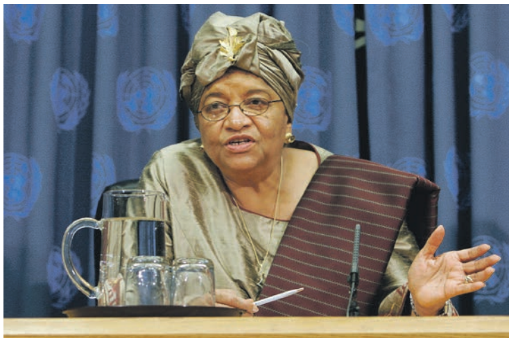
Liberias præsident Ellen Johnson-Sirleaf er født i 1938. Hun blev valgt første gang som præsident i 2005 og er siden blevet genvalgt i 2011. Samme år modtog hun Nobels fredspris.