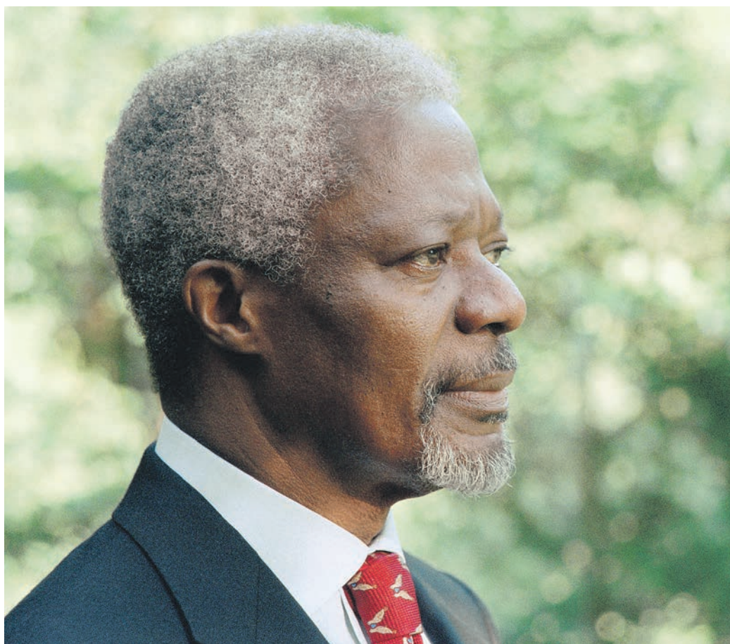
Kofi Annan var FN's generalsekretær 1997-2007 og begyndte reformerne af FN's fredsbevarende operationer.

Reformer af de fredsbevarende operationer stod øverst på dagsordenen, da Kofi Annan i 1997 blev generalsekretær. I dette årti var antallet af missioner vokset meget hurtigt, og FN's fredsbevarende soldater havde fået opgaver, der var meget vanskeligere end før den kolde krig. Alene i 1990'erne oprettede FN's Sikkerhedsråd flere missioner, end FN havde etableret i den lange periode 1945-89. I 1993 var 80.000 blå hjelme udsendt. Det var en ny rekord for FN. I 1989 - lige inden den kolde krig sluttede - havde FN blot 9.950 soldater ude i sine missioner.