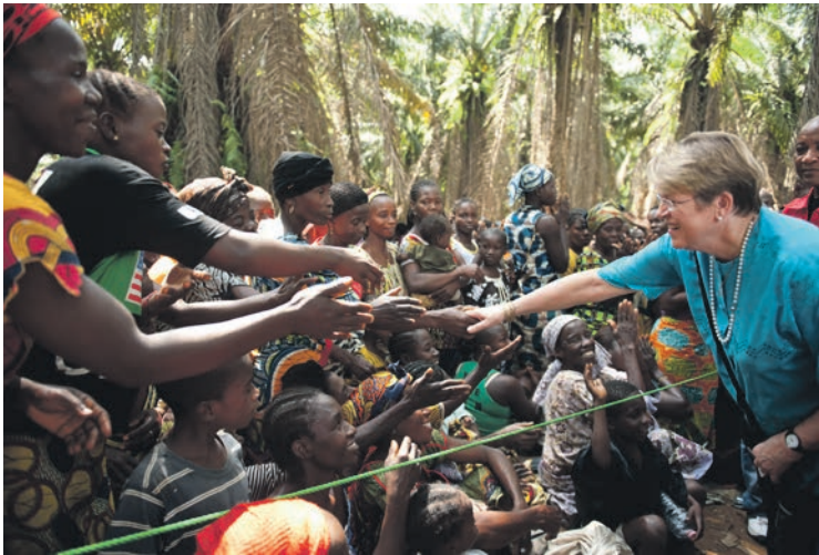
Ellen Margrethe Løj hilser på flygtninge fra nabolandet Elfenbenskysten i 2011. Situationen i Elfenbenskysten blev ustabil efter at taberen af valget i 2010, Laurent Gbagbo, nægtede at forlade præsidentposten og måtte tvinges til at gå af franske tropper og FN-soldater.

Her sluttede problemerne for FN ikke. Da urolighederne var slut i gaderne, blev de indsatte FN-politifolk og FN-soldater, der kom fra to muslimske lande Jordan og Pakistan, beskyldt for at have støttet muslimerne i Lofa. Sådanne rygter er alvorlige for FN, for det er et af grundprincipperne for fredsbevarende operationer, at FN optræder upartisk. Ellen Margrethe Løj skyndte sig at få sagen undersøgt. For ikke at løbe ind i flere påstande om støtte til muslimerne sendte hun to kristne officerer til Lofa for at undersøge, om de jordanske politisoldater og pakistanske soldater havde opført sig korrekt. De kunne hurtigt aflive rygterne. FN's politi og soldater var neutrale under urolighederne. Ellen Margrethe Løj indkaldte næste dag de liberianske medier til en pressekonference, hvor hun afviste beskyldningerne om, at de muslimske politifolk og soldater havde stået på deres trosfællers side under gadekampene. Dermed faldt gemytterne omsider til ro.