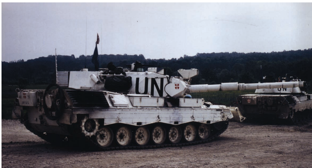
Dansk Leopard 1A5 kampvogn i Bosnien. Det var denne type kampvogn, som besejrede de bosnisk-serbiske styrker 29. april 1994.