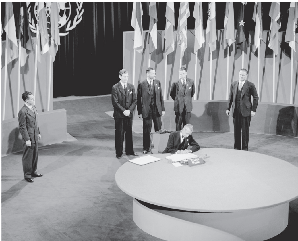
Minister uden portefølje Henrik Kauffmann underskriver FN's charter på Danmarks vegne 26. juni 1945 i San Francisco.

Danmark ville meget gerne være med i FN. Det er en stor fordel for et lille land, at internationale relationer bliver styret af en organisation frem for, at man skal stå alene overfor aggressive stormagter. I Anden Verdenskrig havde Danmark været magtesløs i forhold til det brutale Nazityskland, som holdt landet besat i fem år.