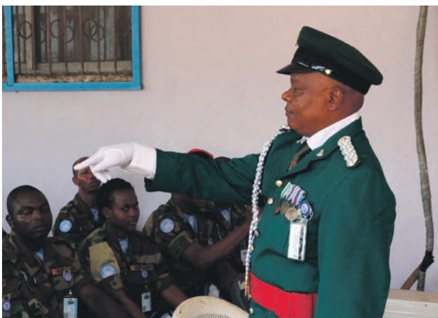
I det nigerianske forsvar er der kvindelige soldater, men de får ikke lov at udføre de samme opgaver som mænd. Her er det nigerianske FN-soldater i Monrovia.