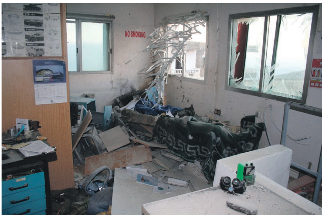
FN's patruljebase Ras i det sydlige Libanon blev smadret under kampe mellem israelske styrker og Hizbollahmilitsen. En dansk FN-observatør ved UNTSO reddede en af sine kolleger, der blev hårdt såret ud af ruinerne.

I 2006 måtte FN endnu gang bede medlemslandene om militære styrker til en mission i Mellemøsten. Israelske styrker rykkede i juli 2006 ind i Sydlibanon for at gengælde et angreb på Israel fra den shiamuslimske milits Hizbollah. Det resulterede i en kort intens krig i juli-august 2006. Bagefter besluttede FN's Sikkerhedsråd at udvide FN-missionen i Libanon, UNIFIL, så den bedre kunne hjælpe den libanesiske regering med at få kontrol over og afmilitarisere Sydlibanon. Sikkerhedsrådet besluttede, at krigsskibe skulle