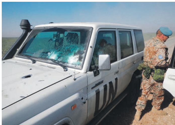
Peter Dahl må forlade sit køretøj ved Kafr Zita, der er blevet beskudt med et tungt maskingevær fra en syrisk kampvogn.

Syrien har også været indblandet i adskillige krige med Israel. I 2000 overtog Hafez al-Assads søn Bashar al-Assad magten i landet og har regeret det siden. Borgerkrigen i Syrien begyndte i 2011 og har drevet millioner af indbyggere på flugt, mens over 100.000 har mistet livet.