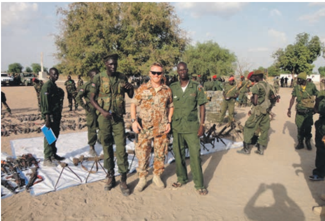
Jacob Palmer Bjerborg inspicere våben, der er indsamlet af Sydsudans hær -SPLA - blandt civile.

Alt i alt lyder det jo vældigt spændende, men lad os nu se, når hverdagen rammer. Min erfaring fra FN er, at der kan være stor forskel på det, der står i opgaven, og det, som rent faktisk bliver gjort. (Uddrag fra rejsebrev).