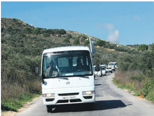
En FN-konvoj kører gennem det sydlibanesiske landskab. De lange rækker af FN-biler irriterede de lokale trafikanter.

efterset i årevis. Forholdene i lejren var nogle steder uforsvarlige for de lokale arbejdere, som skulle tappe gas fra utætte beholdere i et lukket rum. Det fik den danske lejrledelse sat en stopper for. Den var også gal med de køreplaner, som de danske soldater skulle følge. De levede ikke op til køre- og hviletidsbestemmelserne. Også her satte den danske ledelse hælene i, og FN-missionen måtte revidere dem.