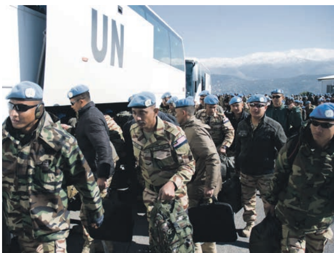
Malaysiske soldater går ind i FN-busser for at blive transporteret til lufthavnen af de danske soldater.

- Vores ledelse slog hårdt ned på dårlige arbejds- og miljøforhold. Det vil vi ikke finde os i, sagde de til UNIFIL, siger Jesper Ellehauge.