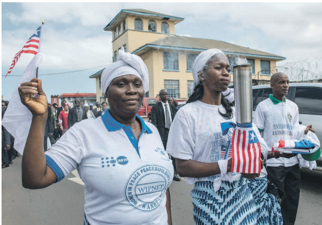
Kvinder fra Liberia fejrer 10-året for fredsftalen i landet. FN-missionen UNMIL blev indledt, da en fredsftale standsede borgerkrigen i Liberia.

En konflikt et sted i verden er ved at eskalere så voldsomt, at den påvirker den internationale fred og stabilitet. I sådan et tilfælde kan FN's Sikkerhedsråd gribe ind og oprette en fredsbevarende mission. Da FN blev dannet i kølvandet på Den Anden Verdenskrig var et af hovedformålene med organisationen, at der aldrig mere skulle udbryde en ny verdenskrig. Grundstenen for FN's virke er FN-charteret. I forordet til FN-charteret står der, at medlemmer ved FN beslutter sig for at 'save succeeding generations from the scourge of war, which twice in our lifetime has brought untold sorrow to mankind' . Det giver dermed FN-mandat til at opretholde international fred og stabilitet, hvilket Danmark som medlemsland har accepteret på lige fod med de 193 andre lande, der er medlem af FN 2 . Hvis en konflikt er ved at udvikle sig alvorligt, og Sikkerhedsrådet løbende får opdateringer om situationen, er det Rådets opgave at gribe ind for at stoppe de store menneskelige omkostninger, der altid følger i kølvandet på krigshandlinger. Store flygtningestrømme, angreb på civilbefolkningen samt mangel på fødevarer kan skabe uroligheder i konfliktens nærområde, hvor ressourcerne typisk er sparsomme.