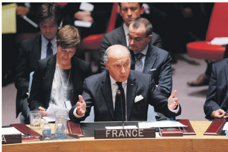
Frankrigs repræsentant i FN's Sikkerhedsråd drøfter Syrien.

Såfremt FN's missioner skulle være mere effektive, bemærkede Brahimirapporten, var der behov for, at missionerne blev bedre udrustet og fik mere både økonomisk og politisk støtte fra FN's medlemslande. Det er ikke altid muligt i en verden, hvor mange medlemslande kan være plaget af økonomisk krise, men FN gør sig store anstrengelser for at forhindre, at missioner bliver oprettet med et utilstrækkeligt antal soldater i forhold til den opgave, de skal løse. Det sker blandt andet ved at indhente forhåndstilsagn fra medlemslandene om troppebidrag, før FN indleder en ny mission.