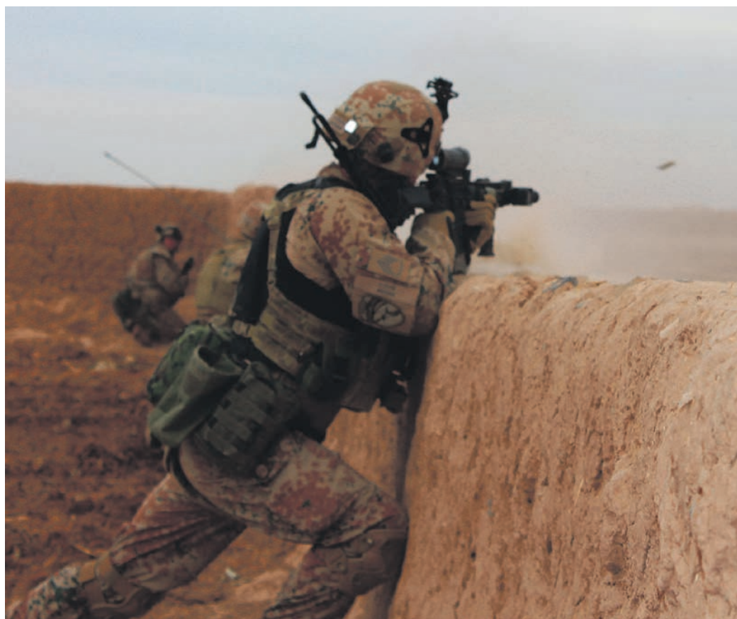
En dansk soldat i ildkamp i Afghanistan i 2012. Den internationale styrke i Afghanistan har et FN-mandat, men operationerne bliver ledet af NATO. Ofte overlader FN de mere kampprægede opgaver til andre organisationer, mens FN tager sig af den fredsbevarende rolle, hvor soldater holder sig strengt neutrale i konflikten.

Selv om danske soldater i de seneste ti år har haft ganske få store troppekontingenter af sted med FN, har danske soldater været udsendt på mange missioner, der har et FN-mandat, men hvor opgaven bliver løst af en anden organisation eller en til lejligheden sammensat koalition af lande. Det er de såkaldte artikel 8 operationer, hvor FN's Sikkerhedsråd giver et mandat til at gribe militært ind, men det ikke er FN selv, som har ansvaret for den militære operation. Danmark har deltaget i en lang række sådanne operationer.