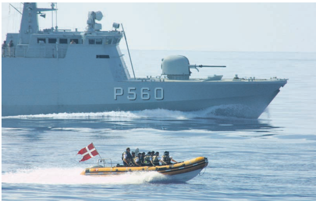
Patruljefartøjet Ravnene overvåger farvandet ud for Libanon.

I alt har omkring 50.000 danske soldater været udsendt med FN's berømte blå hjelm eller baret. De har været med til nogle af de mest markante begivenheder i de 65 år, FN har arbejdet for at få bilagt voldelige konflikter i verden. Danske soldater var med på den første mission med FN-observatører i 1948, den første FN-styrke i 1956 og den første sømilitære FN-styrke i 2006. Danmark har også huset SHIRBRIG's hovedkvarter, og ikke mindst var de danske kampvogne i Bosnien med til at vise, at FN-soldater bør have ordentligt udrustning, så de kan sætte sig i respekt over for parterne i en væbnet konflikt.