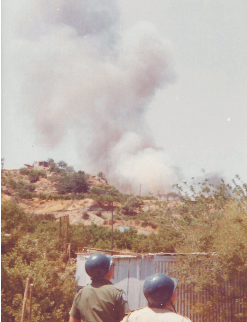
Danske FN-soldater ser til, mens tyrkiske fly bomber byen Limnitis i sommeren 1974.