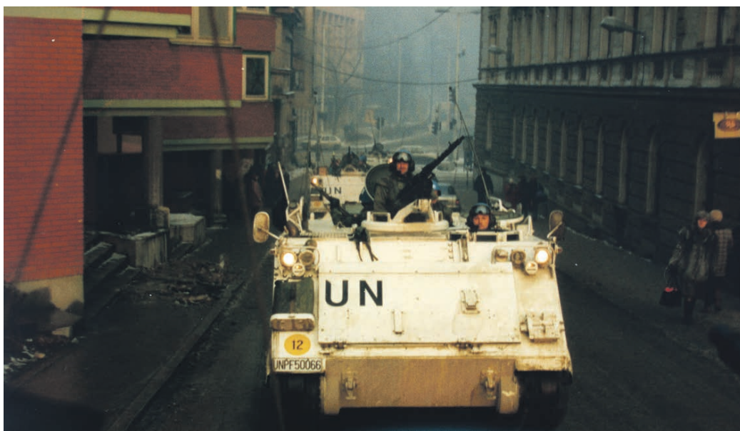
Danske pansrede mandskabsvogne kører eskorte i den belejrede by Sarajevo.

Uroen i det tidligere Jugoslavien spredte sig i 1992 til Bosnien, der havde erklæret sig selvstændigt samme år. De bosniske serbere nægtede at være med i en stat sammen med bosniske kroater og muslimer, og der udbrød krig mellem de tre befolkningsgrupper. Ret hurtigt erobrede de militært overlegne serbere 70% af landet, mens muslimerne var isoleret i små enklaver, hvor der var meget kummerlige forhold. Derfor besluttede FN at udvide UNPROFOR til også at omfatte Bosnien. En ny FN-styrke blev stabled på benene. Dens opgave var at eskortere nødhjælpskonvojer, der ofte blev udsat for chikane og beskydning fra krigens forskellige parter. Danmarks bidrag til denne opgave var i første omgang et hovedkvarterkompagni på 142 mand, som fik base i Kiseljak uden for hovedstaden Sarajevo. Hovedkvarterkompagniet begyndte sin mission i oktober 1992. Diplomaterne arbejdede forgæves for at få fred i Bosnien, og i 1993 besluttede FN at udvide