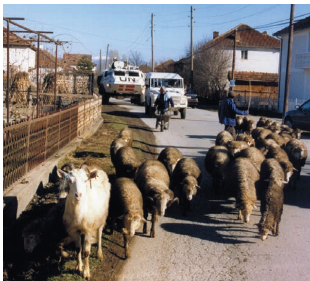
Danske soldater i en finsk pansret SISU-mandskabsvogn på patrulje i Makedonien.