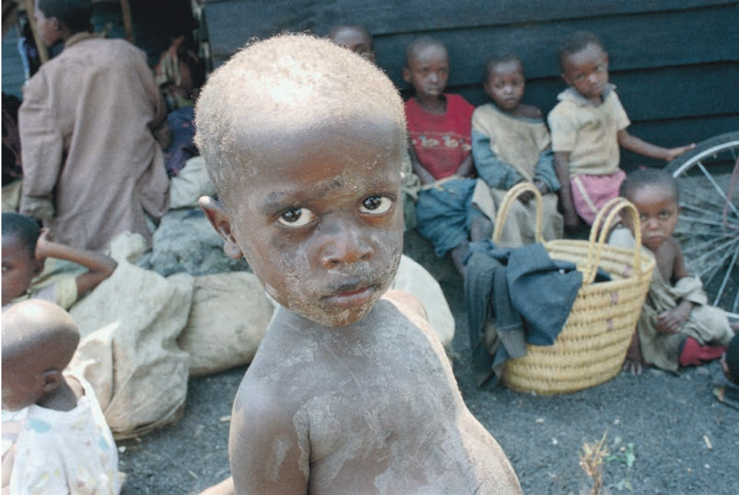
Dreng er flygtet fra folkemordet i Rwanda og befinder sig i en FN-flygtningelejr i Congo 1994.

FN-missionerne i 1990'erne oplevede også logistiske udfordringer i en hel ny skala. De skulle i højere grad operere i lande med besværlige forsyningsveje og dårlig infrastruktur. Vanskelighederne i 1990'erne fik de vestlige lande til at reducere deres bidrag til FN's fredsbevarende missioner meget markant, ligesom det skete med den danske indsats.