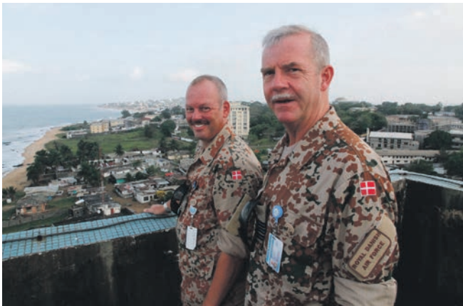
Danske FN-observatører ser på udsigten over Monrovia.

besøgte hun FN-missionen UNMIL's website, hvor hun hurtigt dannede sig et overblik over baggrunden for borgerkrigen og FN's tilstedeværelse i Liberia.