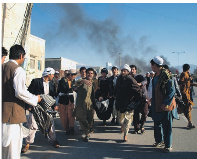
Vrede demonstranter i Mazar-e Sharif i det nordlige Afghanistan 1. april 2011. Her blev UNAMA ramt af en tragedie, da tre FN-medarbejdere og fire nepalesiske vagter blev dræbt, da demonstranterne angreb FN's kontorer i byen. Protesterne var egentligt rettet i mod at en amerikansk præst havde afbrændt koranen, men pludselig rettede demonstranterne deres vrede FN, der intet havde med episoden i USA at gøre. Hændelsen viser FN-missionens sårbarhed i et ustabil land som Afghanistan.

- Som officerer er vi vant til at samarbejde, og vi er ofte resultatorienterede. Vil du opnå resultater, skal du kende den organisation, du arbejder i, så du ved, hvor du skal lægge dit fokus i en given sag. De resultater, jeg opnåede, var først og fremmest, fordi jeg satte mig ind i organisationen og ikke var bleg for at sparke idéer ind, der var nytænkende. Jeg tror den militære komponent, der bestod af officerer, der gjorde tjeneste i 6-12 måneder, var et frisk pust i organisationen og vores resultatorienterede måde at arbejde på, gjorde, at vi insisterede, når vi havde gode ideer, der kunne gøre UNAMA effektiv. Andre civile medarbejdere sad også inde med gode idéer, men de var meget tilbageholdende overfor ledelsen.