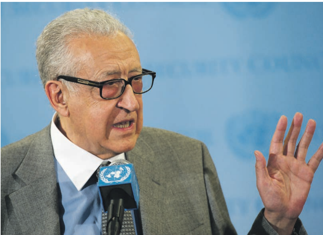
Den algeriske FN-diplomat Lakhdar Brahimi var formand for panelet for FN's panel for fredsbevarende operationer. Siden har han blandt andet været FN og den arabiske liganes særlige repræsentant i Syrien.