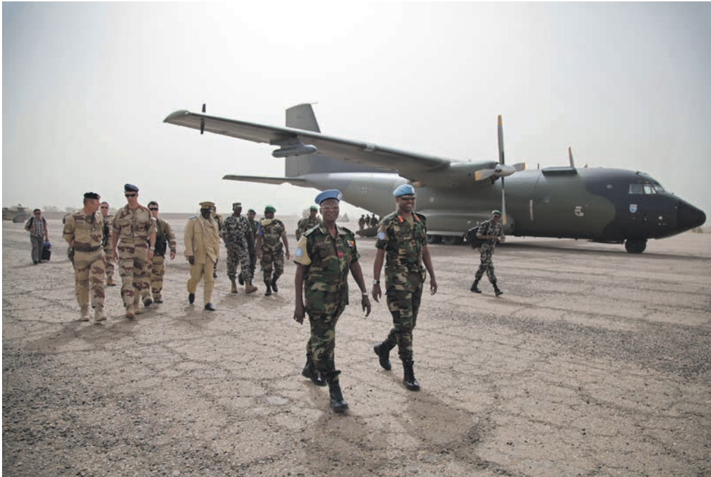
Officerer fra den nye FN-mission MINUSMA besøger det nordlige Mali for at forberede FN-missionens aktiviteter.