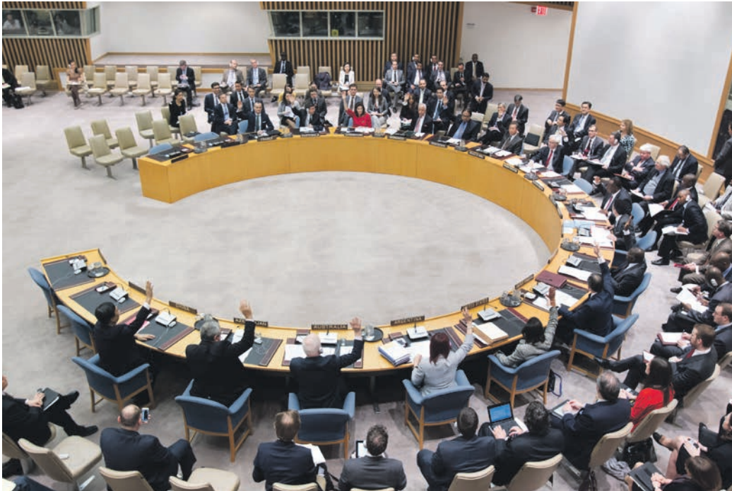
FN's Sikkerhedsråd vedtager enstemmigt at forlænge FN-missionen i Vestsahara. Forlængelse af FN-missionens mandater giver sjældent anledning til de store debatter blandt Sikkerhedsrådets medlemmer.

Når Sikkerhedsrådet har vedtaget en resolution, er Danmark som medlemsnation forpligtet til at acceptere rådets beslutning. Såfremt det er muligt, bør Danmark dermed også udsende tropper til verdens brændpunkter.