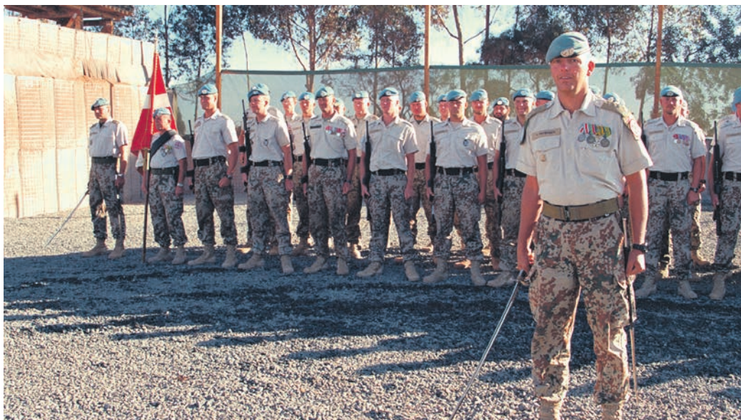
Parade med det danske hovedkvarterkompagni i Asmara i Eritrea.

Selv om FN's fredsbevarende arbejde løb ind i en krise i 1990'erne, fortsatte Danmark med at støtte op om indsatsen. Særlig den socialdemokratiske forsvarsminister Hans Hækkerup (1993-2000) var en stærk tilhænger af FN. Han tog initiativ til at en række medlemslande gik sammen om at oprette en hurtig udrykningsstyrke med hovedkvarter i Danmark. Styrkens navn var SHIRBRIG (Stand-by High Readiness Brigade for UN Operations), og dens stab fik adresse på Høvelte Kaserne sammen med Den Kongelige Livgarde. I 1997 blev SHIRBRIG indviet af FN's generalsekretær Kofi Annan.