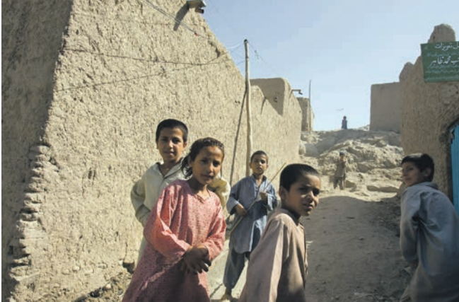
Gadescene i Jalalabad, som ligger i det østlige Afghanistan. Byen har omkring 100.000 indbyggere.

- Jeg rådgav om sikkerhedssituationen i regionen. Derudover rådgav jeg om ISAF-missionen med særlig fokus på overdragelsesprocessen (transitionen) og de militære operationer og støttede de forskellige afdelinger i UNAMA. Desuden skulle jeg støtte i forbindelse med evakuering, eller hvis UNAMA i ekstreme tilfælde skulle få behov for støtte fra ISAF.