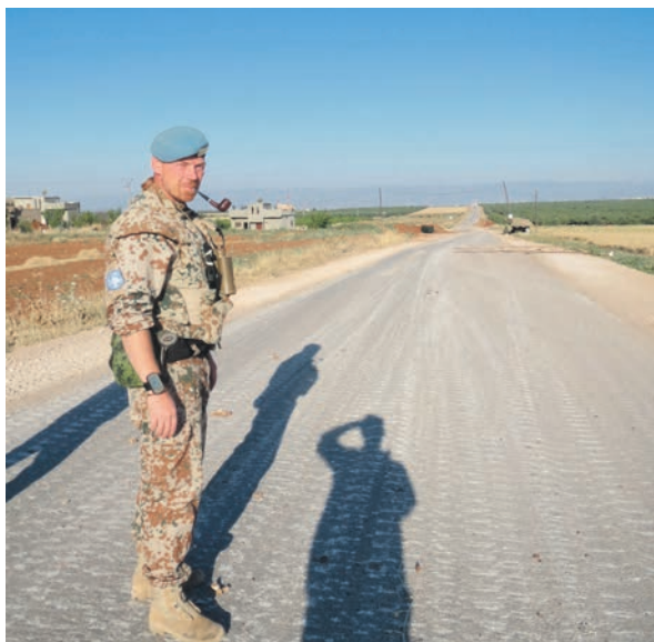
En vej med spor fra bæltekøretøjer. Et godt bevis på tilstedeværelsen af tunge våben.

Patruljen var i begyndelsen meget vellykket. De kørte af sted i to køretøjer og fandt