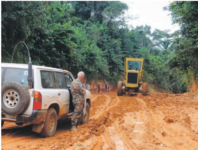
Vejnettet i Monrovia bliver omdannet til et mudret søle i regntiden. Her venter en dansk FN-observatør på at vejen bliver køreklar.

skulle vurdere situationen i landet og på den baggrund udarbejde en plan for reduktion af missionen og især de militære styrker i UNMIL. Sikkerhedsrådet besluttede efterfølgende på baggrund af delegationens anbefalinger, at FN-styrken inden 2015 skulle reduceres med fire infanteribataljoner med tilhørende støtteenheder, og at de tre tilbageværende infanteribataljoner skulle være fra Vestafrika. Det skete med henblik på, at de vestafrikanske landes sammenslutning ECOWAS eventuelt kunne overtage FN's sikkerhedsopgave, såfremt den positive udvikling i landet fortsætter.