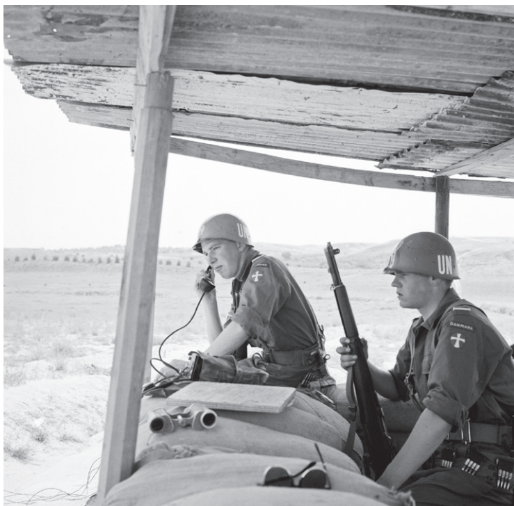
To danske soldater på vagt på våbenhvilelinjen mellem Israel og Ægypten.

I november 1956 blev den danske styrke placeret i byen Port Said i Ægypten. Den første måned var præget af ægyptiske overfald på de britiske soldater, der stadig ikke havde forladt området. Danskerne overtog de steder, hvor de britiske soldater havde været. En enkelt gang beskød snigskytter de danske soldater, og de besvarede ilden. Den ansændte atmosfære forsvandt efter, at briterne gik om bord på deres skibe og sejlede væk i slutningen af december. Næste opgave for UNEF var at marchere igennem den gule Sinaiørken, imens de israelske soldater kørte tilbage til hjemlandet. I marts 1957 nåede