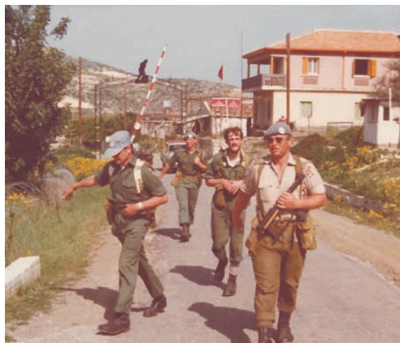
Danske soldater på DANCON-march i 1974. Den første DANCON-march blev gået på Cypern i 1972. Siden er det blevet en tradition i det danske Forsvar, at danske udsendte soldater arrangerer en march, mens de er på mission et sted i verden. I dag har DANCON-marchen også mange udenlandske deltagere.